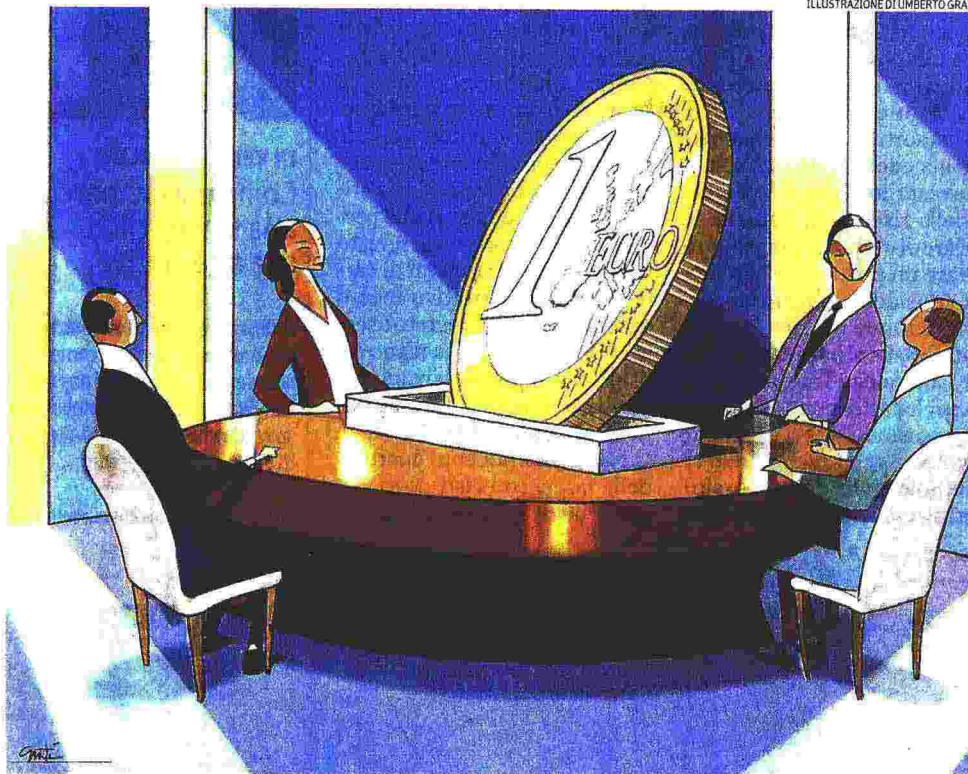
ILLUSTRAZIONE DI LAMBERTO GRATTI